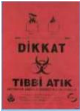
Şekil 3.6 Tıbbi atık torbası [URL 5]