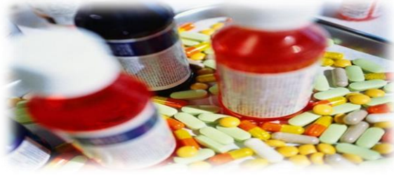
Şekil 3.1 Farmasötik atık [6]