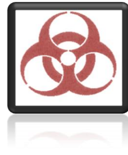
Şekil 3.8 Biyotehlike amblemi [13]