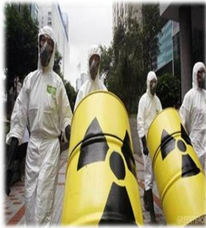
Şekil 3.5 Radyoaktif atık [10]

Radyoaktif atık, serbestleştirme sınırlarının üzerinde aktivite konsantrasyonu içeren ve bir daha kullanılması düşünülmeyen nükleer ve radyoaktif maddeler ile radyoaktif madde bulaşmış ya da radyoaktif olmuş yapı, sistem, bileşen ve malzemeleri ifade eder. [9] Laboratuvarlarda vücut sıvıları ve dokuları üzerinde yapılan araştırmalar nedeniyle meydana gelen katı, sıvı ve gaz atıkları, iç organlarının filmlerinin çekilmesiyle oluşan atıklar, tümör lokalizasyonu sonucu meydana gelen atıklar ve terapi işlemleri atıkları hastanelerde üretilen radyoaktif atıklara örnektir.