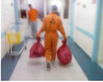
Şekil 3.9 Uygunsuz tıbbi atık taşınması [URL 6]

Kaynağında uygun ayrıştırılan tıbbi atıkların taşınması atık yönetiminin 2. aşamasıdır. Tıbbi atıkların bulunduğu torbalar atık üretiminin yapıldığı birimlerde, bu iş için eğitim verilmiş personel tarafından, tekerlekli, kapaklı, ve sadece tıbbi atıklar için ayrılmış araçlar ile toplanır ve taşınırlar. Tıbbi atıklar ile evsel nitelikli atıklar farklı taşıma araçlarıyla taşınırlar, karıştırılmazlar. Tıbbi atıkların üretilen birimler içinde taşınmasında kullanılan turuncu renkli taşıma araçlarının üzerlerinde “ Uluslararası Biyotehlike ” amblemi ile “ DİKKAT! TIBBİ ATIK ” ibaresi bulunmalıdır. Atıkların taşınması sırasında torbalar kesinlikle elle taşınmamalıdır. Atık bacaları ve yürüyen şeritler kullanılmamalı, ara depolama yapılmamalıdır. Katlar arası geçişlerde asansör kullanılmalı, asansör taşıma sırasında kilitlenmeli ve taşıma bitince kuru dezenfeksiyonu yapılmalıdır. Tıbbi atıklar sabah, öğle ve akşam olmak üzere günde üç defa hastane hareketliliğinin az olduğu saatlerde toplanıp, geçici depolara taşınmalı hasta ve personelin trafiğinin sıkışık olmadığı güzergâh tercih edilmelidir.