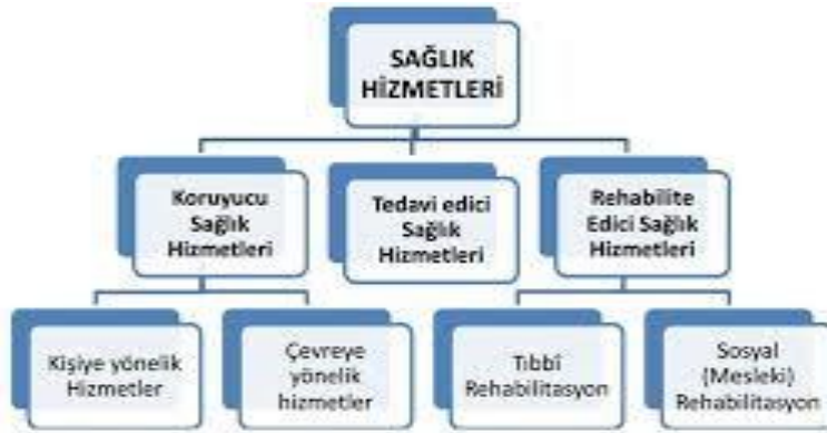
Şekil 2.1 Sağlık Hizmetleri Çeşitleri [2]

Sağlık hizmetleri temelde anahtar kilit ilişkisi içermelerine rağmen idrak edilebilirliğini sağlamak, hizmet sunumunda kolaylık sağlamak, maliyet-fayda analizi elde etmek vb. amaçlarla sınıflandırılmıştır. Koruyucu sağlık hizmetleri, tedavi edici sağlık hizmetleri ve rehabilitasyon hizmetleri adı altında üç ana başlık altında incelenmektedir.