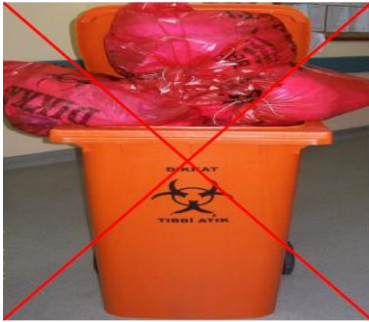
Şekil 3.10 Tıbbi atık taşıma aracının uygunsuz kullanımı [14]