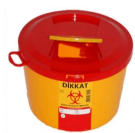
Şekil 3.7 Kesici- delici alet kabı [12]

Tıbbi atıklar, ünite içi atık planında belirtilen toplama saatlerinden farklı saatlerde de toplanmaktadır. Yoğun tıbbi atık üretimi yapan birimlerde ( acil servis, ameliyathane vb.) torbalarda doluluk meydana geldiğinde tıbbi atık personeli çağırılarak atığın üniteden çıkarılması sağlanmaktadır.