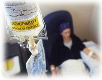
Şekil 3.2 Genotoksik atık [URL3]

Hususi dikkat gerektiren atıklardır. Kullanım alanlarında ve bertarafında güvenlik sorunları oluştururlar. Çok tehlikelidirler. Hücre DNA'sının yapısını değiştirebilme, teratojenik veya kanserojenik özellikleri vardır. Genotoksik atıklardan en önemlileri olan sitotoksik ilaçlar, kimyasal ve radyoaktif maddeleri (kansere tedavilerinde kullanılan) içerirler. Sitotoksik ilaçlar; onkoloji, radyoterapi üniteleri ve nükleer tıp üniteleri gibi spesifik alanlarda kullanılmaktadırlar. İlaçlar hazırlanma aşamalarında kullanılan enjektörler, iğneler, kullanılmamış ilaçlar, kullanılmayan solüsyonlar ve ilaç kullanımı sonucu oluşan metabolizma ürünleri genotoksik atıklardır.