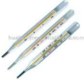
Şekil 3.3 Cıvalı termometre [URL4]

Kadmiyum atıkları ise kullanım süresi geçmiş pillerden meydana gelir. Arsenik içeren ilaçlar, kimyasallar ise farmasötik atık olarak bertaraf edilmektedir.