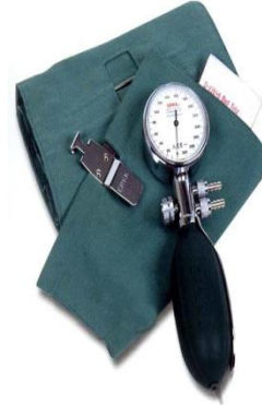
Şekil 3.4 Tansiyon aleti [7]