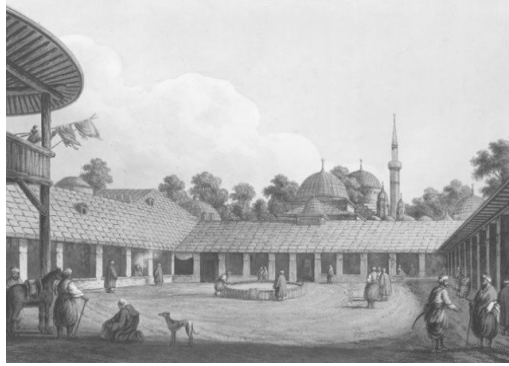
Şekil 3.1: Lüleburgaz Sokullu Külliyesi- Kervansaray Avlusu

başlamıştır. Sokullu Mehmet Paşa'nın kendi ismini taşıyan ve birçok külliye'den daha büyük ve daha fazla fonksiyona sahip olan böyle bir yapıyı inşa etmesi ve çevre düzenlemeleri ile birlikte Lüleburgaz'ı yeniden imar ederek şehir haline getirmesi, Lüleburgaz'ın konumu ve yapısı itibari