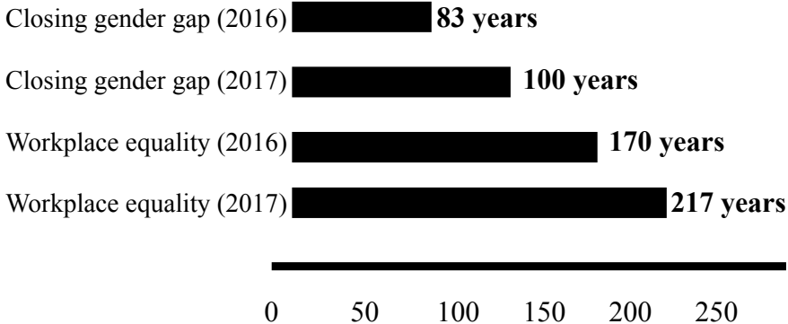
Table 1. Prediction worsen on how long it will take to close gap (URL-1)

World Economic Forum’s report also suggest that, women in the world earn less not just because of “gendered salary differences”, unfortunately because women are forced to do unpaid or part-time work than men in their countries social economic system. Strangely, this ‘economical gender gap’ is also exist in well-educated white-collars in such work areas like professionals, managerial, administrates and senior roles in governmental departments and private companies. According to data’s from the World Economic Forum unfortunately, women in Turkey coming 131st on the list with a gender equality score of 144 countries (see Table 2).