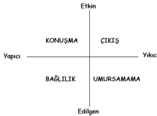
Şekil 2.4: Rusbult'un Çıkış/ Konuşma/ Bağlılık/ Umursamama (Exit/ Voice/ Loyalty/ Neglect Model) (Rusbult, 1987; Akt: Demirtaş, 2004)