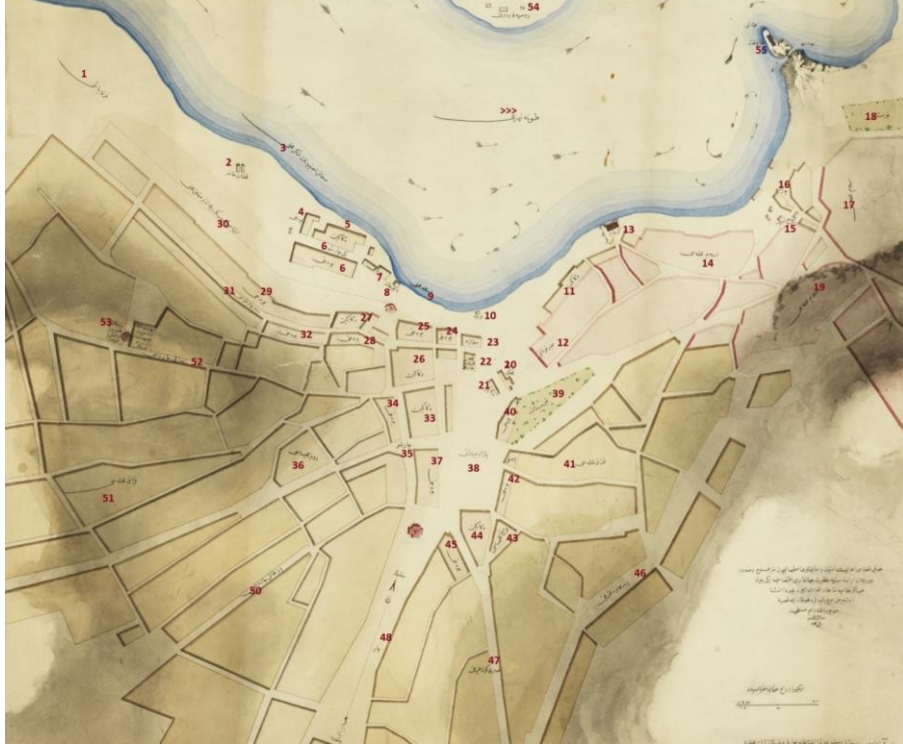
Tulça Şehri (1850) 63

Şehrin merkezini ikiye bölen ve Pazar Meydanı'nda birleşen ana yolun batı bölgesi; kıyı şeridi hariç, dört ana cadde ile merkeze ulaşır. Garımüslim halkın yoğun ikamet yerleri olan bölgede, Müslüman yerleşim yerlerinde olduğu gibi Kazaklara ait yerleşim birimlerinin teşkili dikkat çeker. Bölge batıdan doğuya; Rum Çarşısı istikametinde Nemçe (Avusturya) Konsoloslugu'na uzanan yol ile birlikte hemen güneyinde yer alan İsakçı Caddesi ve güneybatı istikametinden Babadağı Caddesi ile Pazar Meydanı'na ulaşan dört ana güzergâha ayrılır. Batı bölgesi, Rum Çarşısı, Rum Kilisesi ve çok sayıda çarşı ve dükkânlardan oluşan ticari işletmelerle çevrilidir. Kıyı şeridi ise balıkhane, kalafathane, yeni çarşı gibi tesislerle iskeleye en yakın bölgeyi oluşturmaktadır.