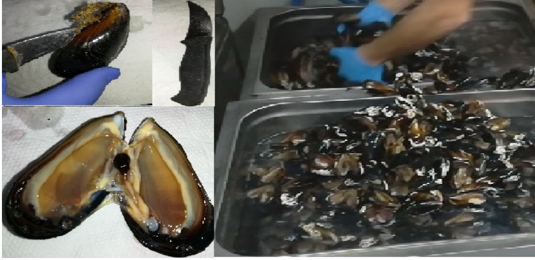
Şekil 2.6: Midyelerin açılması ve yıkanması

sıcak olarak tezgahlarda; soğuk olarak tepsilerde satışa sunulur (Şekil 2.2.3 ve Şekil 2.2.4).