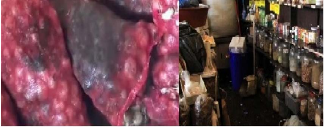
Şekil 2.10: Midye dolma malzemelerinin uysunsuz muhafazası

a. Midye dolmanın içeriğinde (pilavında-reçetesinde) kullanılan malzemeler: Midye dolmalar hazırlanırken baharatlar, pirinç, soğan gibi pilavında kullanılan malzemelerin uysunsuz yetiştirilme koşullarından, hasadından ve muhafaza koşullarından bakteri ve maya-küf kontaminasyonu gerçekleşmektedir (Şekil 2.3.1) ve kontaminasyonun etkisi ortadan kaldırılmazsa gıda kaynaklı zehirlenme ve hastalıklara neden olmaktadır (Durgun, 2013; Hayashi ve diğ., 1994).