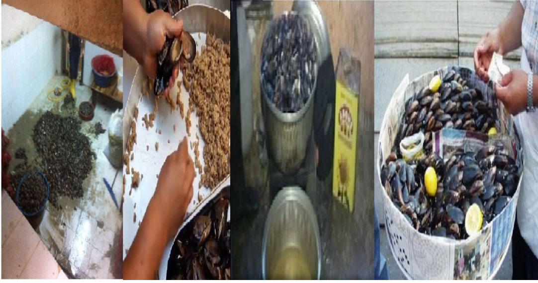
Şekil 2.11: Midye dolma uygunsuz üretim-satış koşulları

Gıda çalışanlarında meydana gelebilecek çıban, yara ve kesiklerdeki S.aureus 'un gıda üretiminde bulaşma sonucu zehirlenmelere yol açabilir ve personel eğitimi yetersiz (tuvalet alışkanlığı kazanmamış) kişiler fekal kaynaklı E.coli ile gıdaları kontamine edebilir (Ünlütürk, 1999).