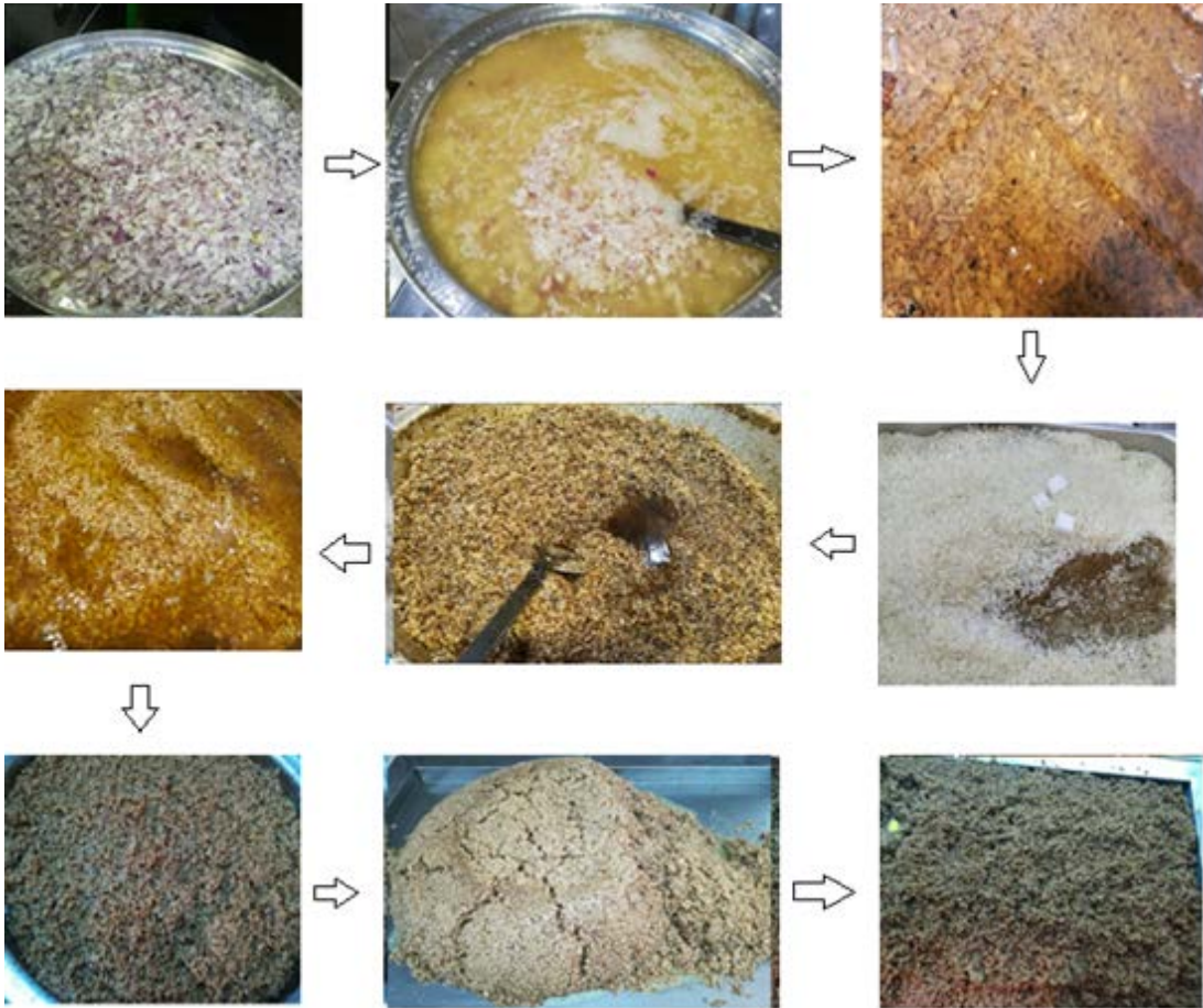
Şekil 2.7: Midye dolma iç pilavının hazırlanması