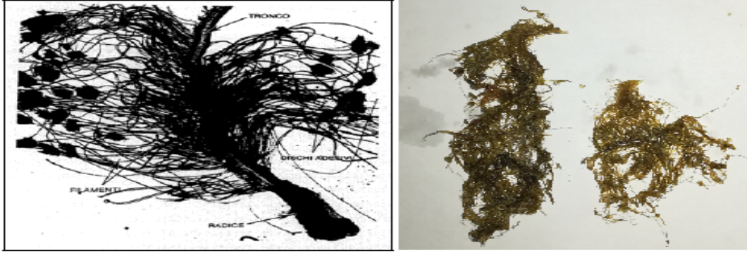
Şekil 2.3: Midyelerin yüzeylere tutunmasını sağlayan bissus lifleri(Alpbaz, 1993).

Ekolojik şartların farklı olmasından dolayı, Karadeniz, Ege Denizi ve Marmara Denizi'nden toplanan midyelerde oldukça fazla renk, şekil ve desen varyasyonu göstermektedir. Ama anatomik yapı bakımından herhangi bir fark gözlenmemiştir. Karadeniz'den itibaren Akdeniz'e doğru sahillerimizde, Mytilus galloprovincialis yavaş yavaş azalır. Tuzluluğun bir dereceye kadar düştüğü bölgelerde, midyelerin çok iyi geliştiği gözlenmiştir. Burada görüldüğü gibi, midyelerin dağılışında tuzluluk ve su sıcaklığı önemli bir rol oynamaktadır (Alpbaz, 1993).