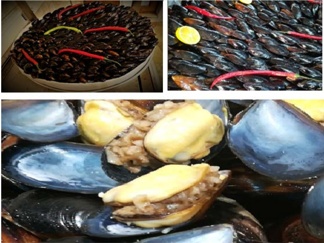
Şekil 2.9: Midye dolmaların sunumu