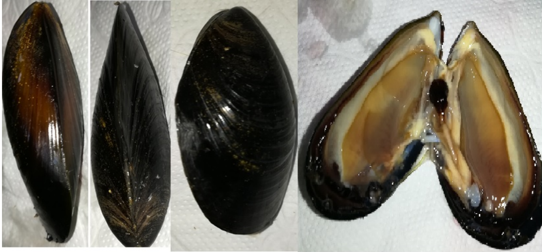
Şekil 2.1: Kara midye ( Mytilus galloprovincialis )'nin farklı açılardan görünüşü