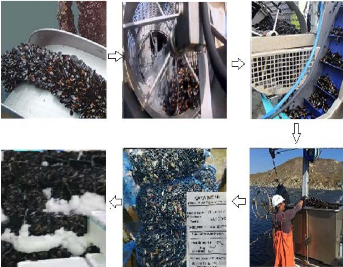
Şekil 2.3: Midye hasadı ile sevkiyatı arasındaki aşamalar