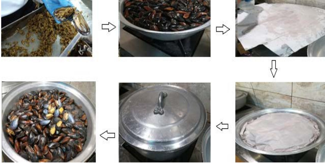
Şekil 2.8: Midyelerin doldurulması ve pişirilmesi