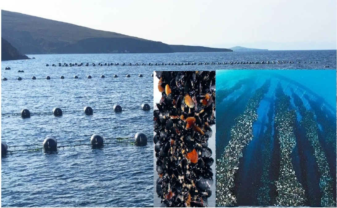
Şekil 2.2: Midye üretim çiftliği

temizlenir, arındırılır-ayıklanır, boyutlandırılır ve ambalajlanıp-etiketlenerek işlenecek ürün yerine sevk edilir(Şekil 2.1.5 ve Şekil 2.1.6)