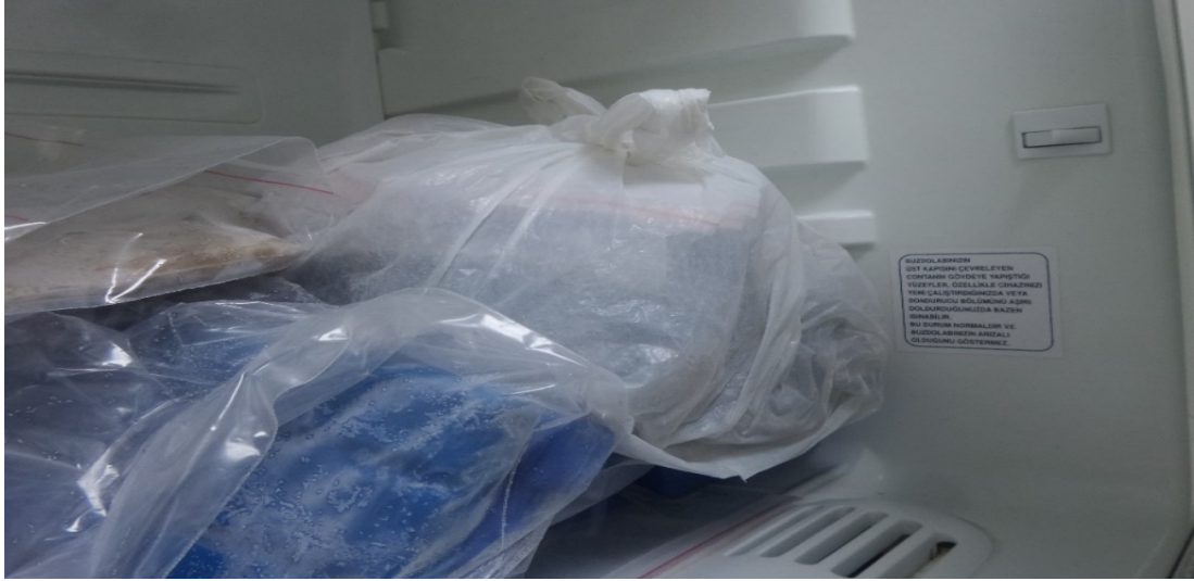
Şekil 3.1: Midye dolma örneklerinin soğuk şartlarda muhafazası

Çalışmada kullanılan midye dolma örnekleri Mart ve Mayıs (2016) ayları arasında İstanbul'un (Arnavutköy, Beykoz, Çatalca, Kâğıthane, Sarıyer, Silivri, Şile ilçeleri hariç) 32 ilçesinden her satıcıdan 4-5 adet bir numuneyi temsil etmek üzere 25 sokak satıcısından ve 25 kapalı mekân satıcısından temin edilmiştir. Temini takiben örnekler steril ve soğuk muhafaza şartlarında laboratuvara getirilmiştir (Şekil 3.1.1).