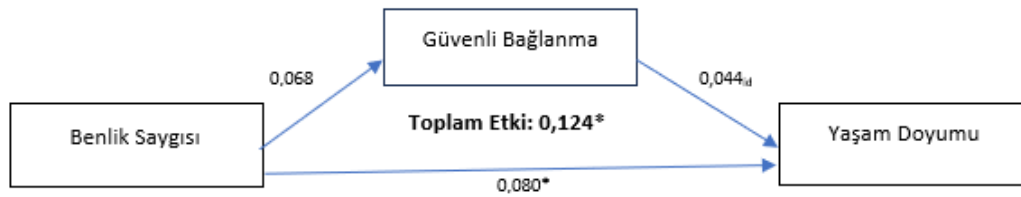
Şekil 2. Şekil 2. Benlik saygısının yaşam doyumuna etkisinde

Model 2'ye göre, benlik saygısının güvenli bağlanmaya pozitif ancak anlamsız bir etkisi vardır. Benlik saygısının yaşam doyumuna doğrudan etkisi pozitif yönlü ve anlamlıdır . Güvenli bağlanmanın yaşam doyumuna etkisi ise pozitif yönlü ve anlamlıdır. Benlik saygısının güvenli bağlanma üzerinden yaşam doyumuna etkisi pozitif, fakat anlamsız dolaylı etkisi vardır. Toplam etki ise pozitif yönde ve anlamlıdır. Model varyansın %44,1'ini anlamlı şekilde açıklamıştır (p<0,05).