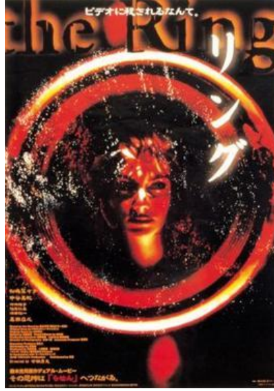
Şekil 4 Ringu (1998) Film Kapağı.