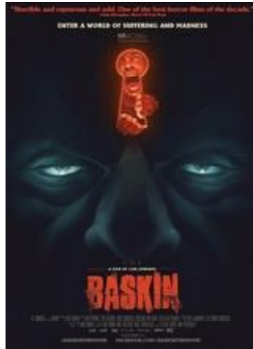
Şekil 7 Baskın (2015) Film Kapağı.

Filmin popülaritesi büyük ölçüde orijinal hikayesi, ürkütücü sinematografisi ve filmin ses tasarımcısı Can Başakçının olağanüstü çalışmalarından kaynaklanıyordu.