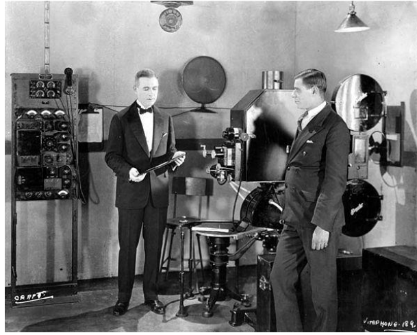
Şekil 3 Vitaphone projeksiyon kurulumu

Filmler, sesin tanıtılmasıyla çok daha fazla dikkat çekti. Ek olarak, ses konusunda liderler arasında yer alan Hollywood sinemasının yurtdışına açılmasına ve on yıl içinde diğer tüm filmleri hızla geçmesine yardımcı oldu.