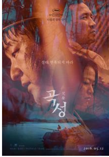
Şekil 5 The Wailing (2016) Film Kapağı.

Film, ürkütücü ortamı ve güçlü karakterleriyle inanç ve korku konularını ele alıyor. Özellikle, filmin ürkütücü ve nahoş atmosferi, Kang Hye-jung'un ses tasarımıyla zenginleştirilmiştir.