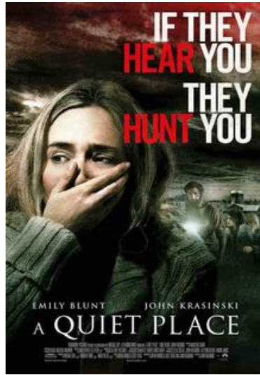
Şekil 6 A Quiet Place (2018) Film Kapağı:

Filmin psikolojik durumunu iyileştirmek ve karakterlerin yaşadığı sessiz evrenin korkusunu arttırmak için Erik Aadahl ve filmin ses tasarımcısı Ethan Van der Ryn, karmaşık bir ses tasarımı üretmek için birlikte çalıştı.