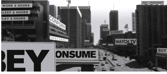
Görsel 3. John Carpenter, They Live (Yaşıyorlar) , 1988.

Angeles'ta dolaşırken kullanıma kapatılmış bir kiliseye gider ve burada içi güneş gözlükleri ile dolu olan bir kutuya ulaşır. Güneş gözlüklerinden birini takarak reklam afişlerine baktığında altında ideolojik bir propagandanın yattığını ve bu gözlüklerin asıl mesajının ideolojiler tarafından gizlenmiş gerçeği göstermek olduğunu anlar. "Kendinizi ideolojiden kurtarmak, özgürleştirmek ve gerçekliği olduğu gibi görmek için gözlükleri çıkarmanız değil, tam aksine gözlükleri takmanız gerekir. İnsan doğası yoz ve kirlidir; doğal hale geri dönmek diye bir şey yoktur, doğal varlıklar olarak dünyaya baktığımızda bakışımız ideolojiktir (Fiennes, Sapiğin İdeoloji Rehberi, 2012)" . Toplular ideolojilerin istekleri doğrultusunda şekillenmektedir. Bu uğurda pek çok değerlerimizi yitirdiğimiz kabul etmeye mahkûm olduğumuz bir gerçektir. "Gerçek bakış açımızı bulandırır, ideoloji bizlere basit bir şekilde empoze edilmez. İdeoloji denen şey sosyal dünyayla sürekli ve olarak geliştirdiğimiz ilişkidir (Fiennes, Sapiğin İdeoloji Rehberi, 2012)" . Sinema bünyesinde muhalif değerleri barındırmaktadır. Sinemanın devrimi hiç şüphesiz anarşizm ile olacaktır.