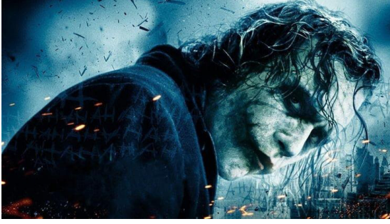
Görsel 7. Christopher Nolan, The Dark Knight (Kara Şövalye), 2008.