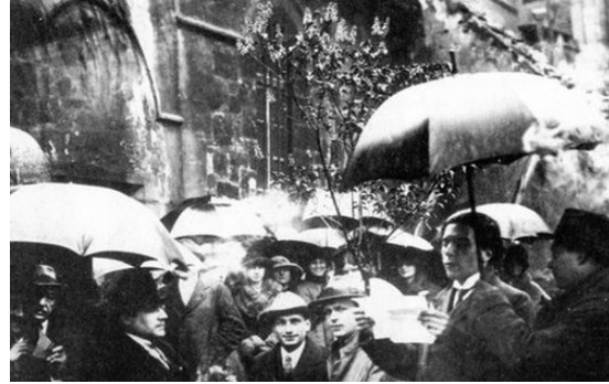
Resim 3: Tristan Tzara Dada gezintisinde kalabalığa metin okurken, Saint Julien le Pauvre, 14 Nisan 1921.

Dada gezileri ve daha sonra Sürrealizmde görülen mekânda eylem üretme amacıyla yapılan gezintiler (deambulation), temsilin yerine "eylemin" kendisini geçirmenin tarihsel dayanak noktalarıdır. Bu, kentin ve hareketin temsilinden, yürüme eyleminin kendisiyle ve olağan kentin yerleşimine doğru bir harekettir. Bu halıyla, flâneur figürünün kayıtsız bir gözlemci halinin değil, aktif bir katılımcının varlığından söz edilebilir (Coverley, 2012: 184) (Baudelaire, 2007 & Benjamin, 2007). Dadaizm, böylece yürüme eylemine bir "anlam" katmaya çalışmıştır. Bu anlam, sanatın sadece görsel haz veren bir nesne üretiminin aksine, mekâna ve performansa dayalı bir deneyim olarak kavranmasıdır. Böylece kent ve çevre, yeni bir vizyonla ele alınmaya başlanmıştır.