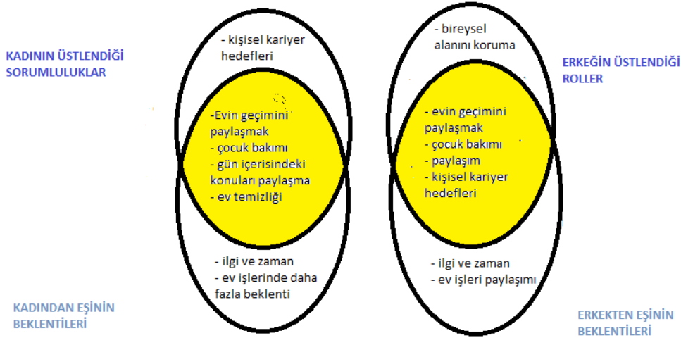
Şekil 2.2: Modern Evliliklerde Beklentiler ve Üstlenilen Roller