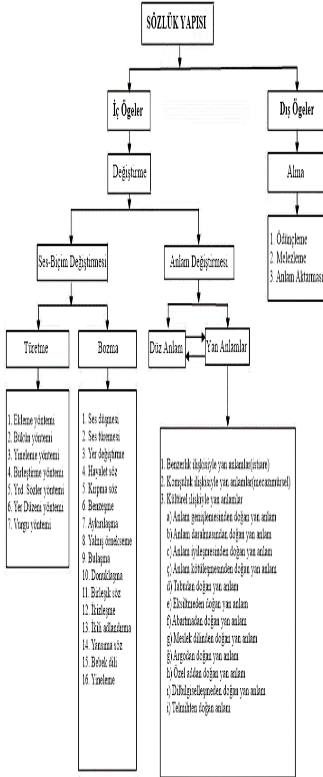
Çizelge 1.1: Sözlük Yapısı