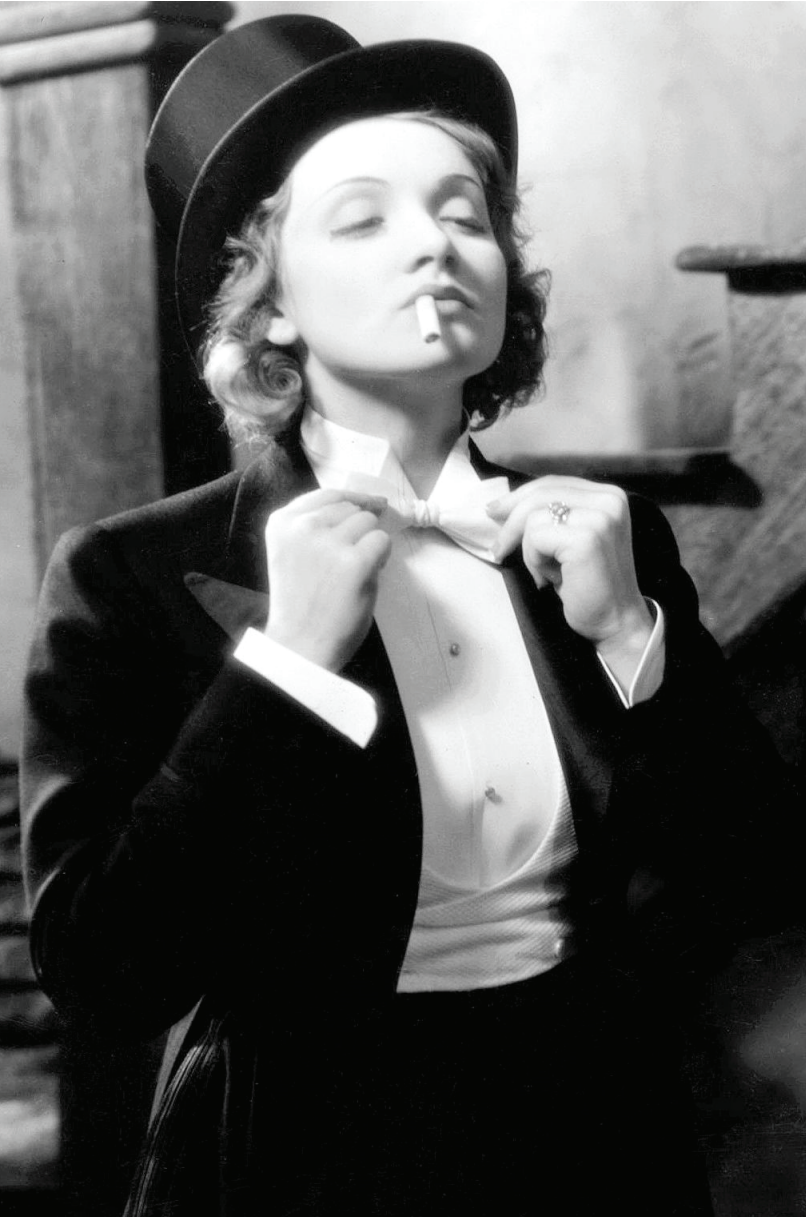
Görsel 1: Morocco (1929), Marlene Dietrich Erişim: 01.02.2019.

Moda kavramı popülerite üzerinden yönetilen bir sistemdir. Moda, trendler oluşturularak bu trendlerin sistematik olarak yayılması şeklinde hareket eder. Bu organik yapı kitlesel boyutlara vardığında amacına ulaşmış olur; döngüsünü tamamlayan trendlerin yerine yenisi gelir. Bu hareket sanayi devriminden itibaren ivme kazanmış, gelişen teknoloji ve artan kitle iletişim araçlarıyla birlikte çeşitli sistemlere oturtulmuştur.