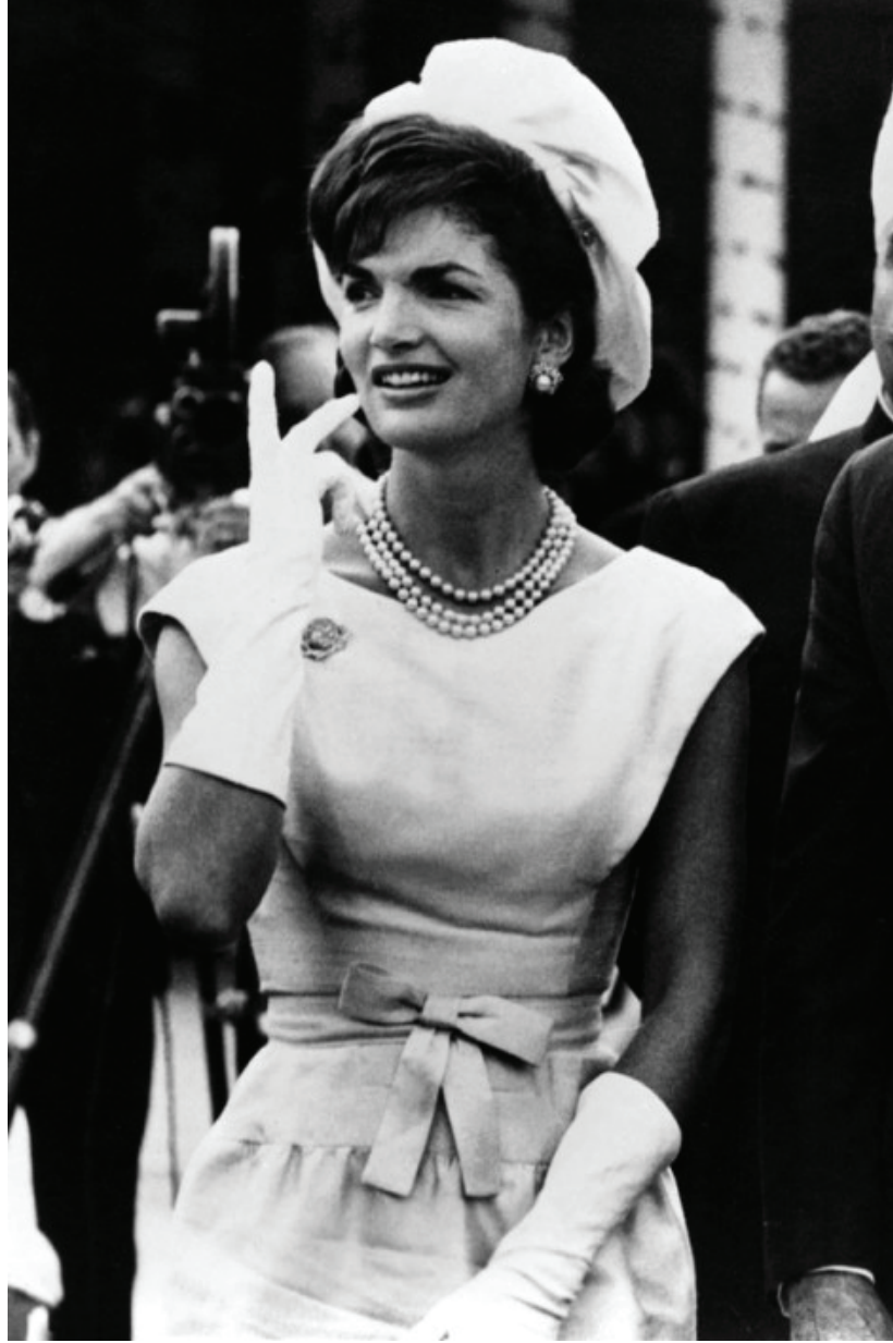
Görsel 4: Jackie Kenndy, 60'lı yıllar Erişim: 01.02.2019.