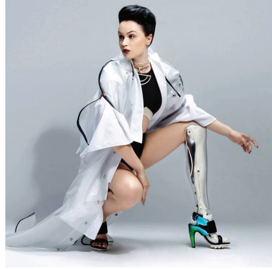
Görsel 9: Viktoria Modesta, 1988 doğumlu ampute şarkıcı-model. Erişim: 10.10.2018.

Viktoria Modesta (Görsel 12), doğuştan gelen genetik bir rahatsızlık yüzünden bacağını ampute ettirmek zorunda kalmıştır. Kullandığı farklı tasarımlardaki protezler sebebiyle kendisine 'Bionic women' denmektedir.