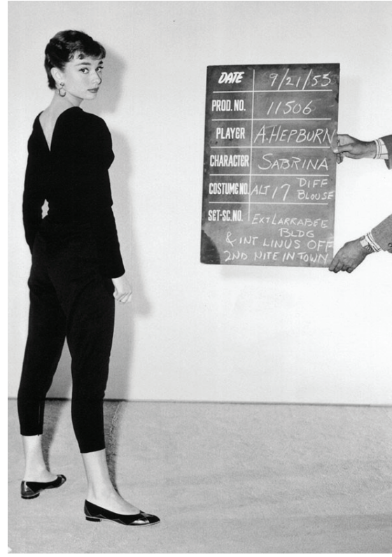
Görsel 3: Audrey Hepburn, 1953 Erişim: 01.02.2018.

1950'li yıllarda yeni bir yıldız doğdu. Audrey Hepburn kapri pantolonuyla boy gösterdiğinde yeni bir kadın tipi ortaya koymuştu. Bu minyon, feminen ama çocuksu kadın sinema perdesindeki tarzını günlük hayata taşıyarak özgür kadının yeni sembolü oldu. Kısa kahküllü saçları, göğüs hizasına kadar düğmelerini açtığı gömleği ile yeni bir dil oluşturmuştu (Görsel 3).