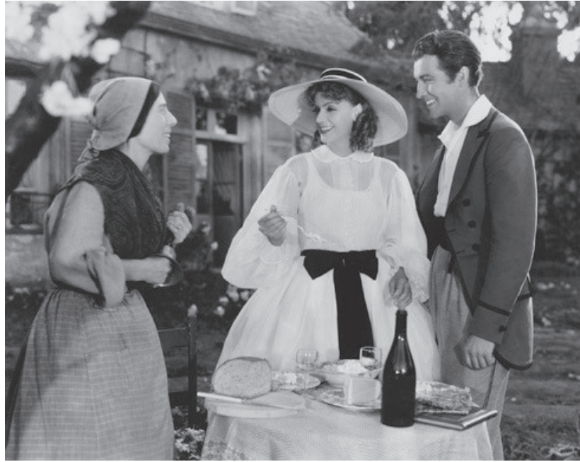
Görsel 2: Greta Garbo, Kamelyalı Kadın (1936)

20. Yüzyılın en temel kadın tipi; ev kadını, anne, eş gibi özellikleri olan, giyim-kuşam, hal-hareket yönünden de toplumsal ahlak algısına uygun olması beklenen bir stereotiptir. Bunun karşıtı olan kadın tipleri de yine sinema perdesinde 'uygun olmayan/tasvip edilmeyen' bir örnek olarak yer alıyordu. Birinci Dünya Savaşı ile beraber iş hayatına girmek zorunda kalan kadınlar ile beraber, yeni bir modern kadını gerçeği ortaya çıkmış ancak dağılan aile düzenini toparlamak adına ev kadını imajının da propagandası yapılmıştır. Özellikle feministler tarafından benimsenen modern kadın, caz ve dans çılgınlığında partileyen, öncesinde hafifmeşrep kabul edilen gösterişli giysileri istediği gibi giyen, çalışan hatta pantolon giyen bir kadın tipi olarak ortaya çıkmıştır. Bu kadın tipi pek çok edebiyat eseri ve sinema filmiyle desteklenip kadınları daha cüretkar hale getiren bir popüleriteye kavuşmuştur.