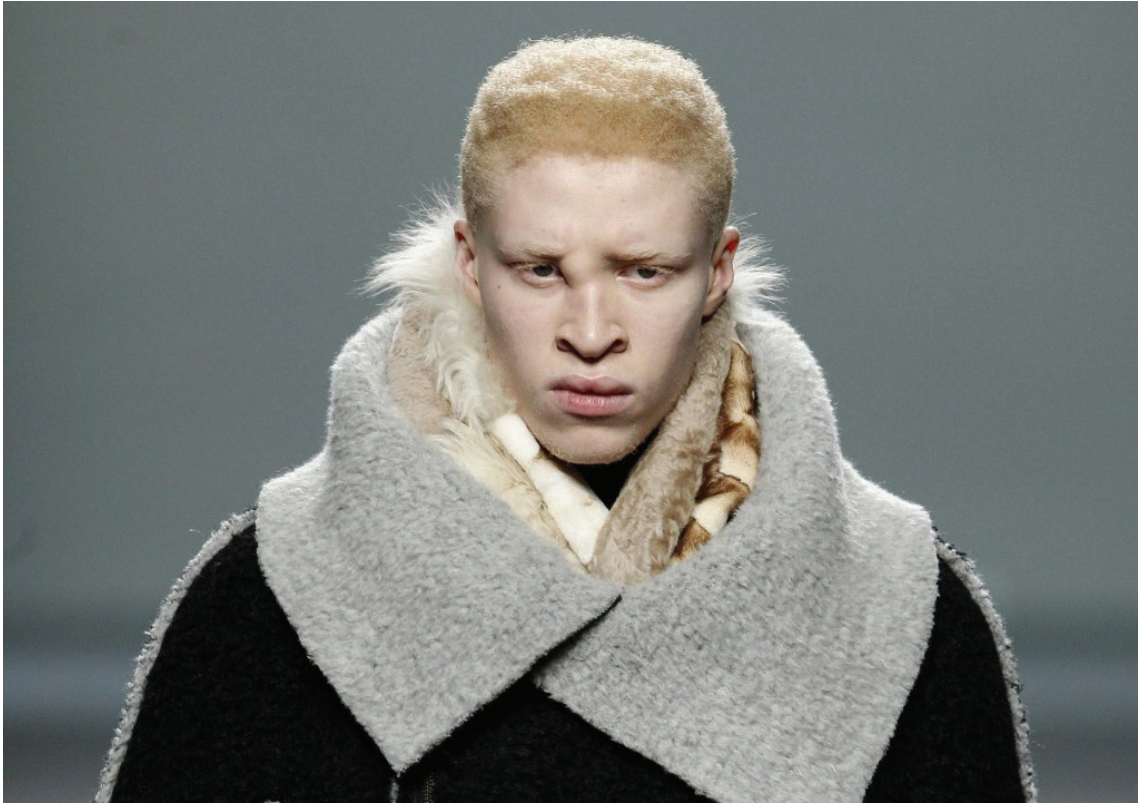
Görsel 7: Shaun Ross, 1991 doğumlu albino model. Erişim: 10.10.2018.

Tiller Girls önemli bir ikon olarak 60'lı yıllara kadar etkisini sürdürmüştür. İlk çıktıklarında kadın tipinin kaynağı olurken sonraki yıllarda sinemanın yarattığı kadın tiplerine uyum sağlayan kadın sterotiplerine uyum sağlayan kişileri seçerek varlıklarını sürdürdüler.