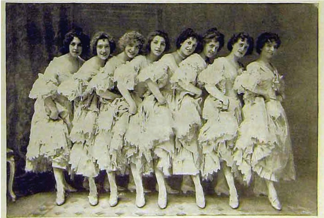
Görsel 6: Tiller Girls, 1897 Erişim: 02.02.2019.

Tiller Girls bu göstergelerin yarattığı ilk kadın stereotiplerindendir (Görsel 6). 1890'larda eğlence dünyasına girmiş, yeni kadın tipini fazlasıyla etkilemiş bir dans topluluğudur. Tiller Girls, John Tiller tarafında kurulmuş, aynı fiziksel özelliklere sahip genç kızlardan oluşturulmuş bir ekiptir. Bu toplulukta yer alan tüm kadınlar, hemen hemen aynı boy ve kilodadır. Hatta saç renklerinden, saç tiplerine kadar benzer özellikler taşırlar. Bu kadınlar, kendi dönemlerinin vamp divaları olmuşlardır. Sımsıkı topuzlu saçlar, korseler ve son derece muhafazakar sayılabilecek giysiler ile dolaşan kadınları olduğu bir çağda, zincirlerini kırmak isteyen kadınların idolüdür. Tiller Girls Amerika'dan Avrupa'ya hatta Hindistana kadar çok geniş bir coğrafyada kendini gösteren, "estetik ilginin odağı"na (Kraucer, 2011, s. 50) dönüşmüş bir oluşumdur. Kraucer bu oluşumları "Kitle Süsü" olarak isimlendirmiştir.